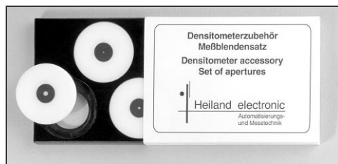
TD1 Wechselbare Meßblenden